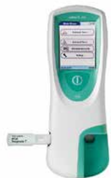
cobas h 232 POC System